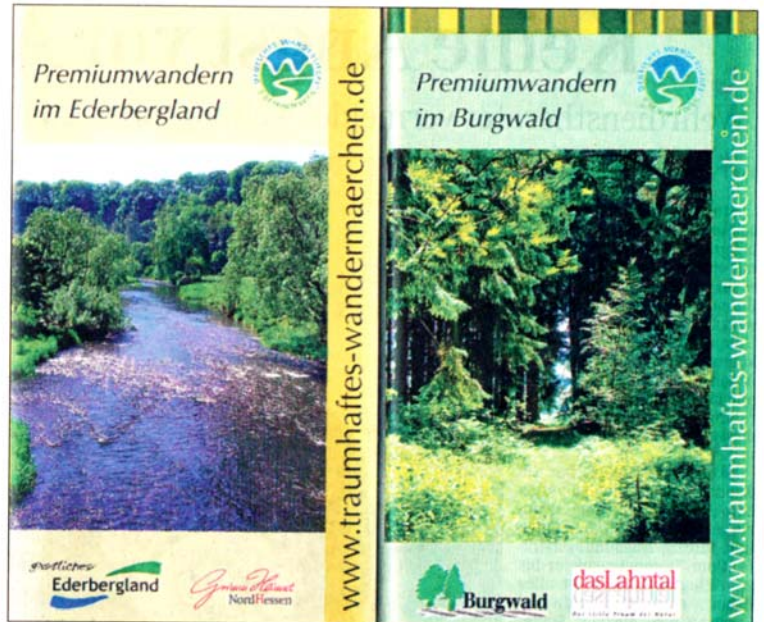
Wirbt für die Region: der Taschenwanderführer Burgwald-Ederbergland.